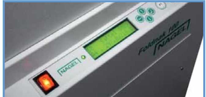
Foldnak 100/80 – einfach und schnell bedienbar.

■ Den Foldnak 80 hat Nagel gezielt für die professionelle Broschürenfertigung im Digitaldruck entwickelt. In seiner Grundkonstruktion ist der Foldnak 80 baugleich mit dem Foldnak 100. Hauptunterscheidungsmerkmale sind die eingesetzten Heftköpfe mit 5.000er Klammermagazin, die einen reibungslosen Produktionsfluss gewährleisten.