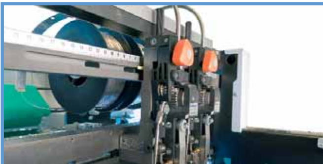
NAGEL Foldnak 100 – Blick auf die Drahtheftköpfe.

■ Der Foldnak 100 ist durch den Einsatz von Drahtheftköpfen bestens für die industrielle Fertigung von Broschüren geeignet. Der moderne Broschürenfertiger besticht mit seinen Funktionen: Automatische Formatverstellung, einfache Bedienung, außerordentlich große Formatbandbreite. Das derzeit größte Format (364 x 521 mm) moderner Digitaldrucksysteme verarbeitet der Foldnak 100 ebenso mühelos wie besonders kleine Formate (105 x 148,5 mm). Dank der Vielfalt an Ausgangsformaten und Funktionen lassen sich Broschüren unterschiedlichster Größe, Grammatik und Blattanzahl äußerst flexibel fertigen. Ob Heften und Falzen, nur Falzen oder Blockheften, der Foldnak 100 bietet vielseitige Finishing-Möglichkeiten.