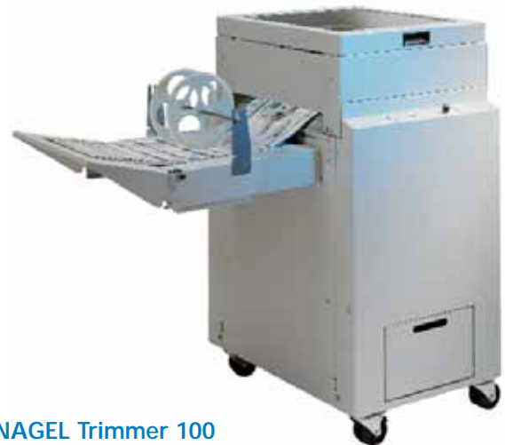
NAGEL Trimmer 100

■ Der Trimmer 8 ist von den Funktionen identisch mit dem Trimmer 100, er unterscheidet sich nur durch seine Höhe, da er für die Kopplung an den bewährten Foldnak 8 entwickelt wurde.