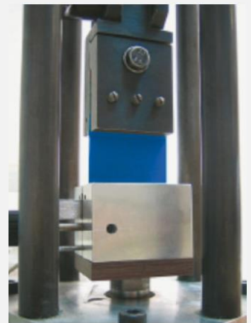
Qualitätsprüfung: Schienenausreistest (>400 N/cm): bestanden